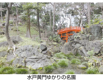
水戸黄門ゆかりの名園

★ 新宿御苑(国立競技場) 「千駄ヶ谷門」からの入園がベスト。入園料は200円。「新宿御苑」は江戸時代、信濃高藤藩内藤家