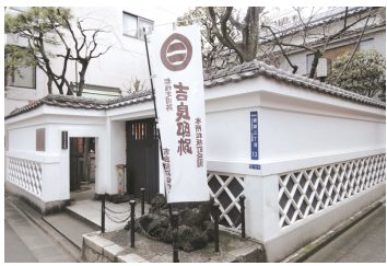
吉良邸は物凄い大きなお屋敷だった！

「ももんじや」からも近い「本所松坂公園」で、そこは「忠臣蔵」でお馴染みの赤穂浪士に討ち入りされた「吉良上野介」の上屋敷跡地なのです！現在の広さは当時の86分の1と、吉良邸がいかに広い屋敷だったかが分かります。