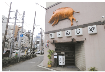
江戸の老舗の味「山くじら」を食べよう

「ももんじや」からも近い「本所松坂公園」で、そこは「忠臣蔵」でお馴染みの赤穂浪士に討ち入りされた「吉良上野介」の上屋敷跡地なのです！現在の広さは当時の86分の1と、吉良邸がいかに広い屋敷だったかが分かります。