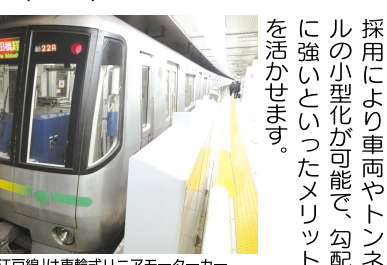
「大江戸線」は車輪式リアモーターカー

「ポイント③ 大江戸線飯田橋駅の秘密」大江戸線は近年開通した地下鉄な為、地上から深い駅が多く、やはり「飯田橋」駅も深いのですが、それ以外にも、ある特徴があります。実は、著名な建築家が設計した駅で、国内で最も権威のある「日本建築学会賞」を受賞しています。乗り降りには不便ですが、所々に大胆な建築アートを楽しめます(パイン)