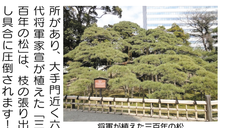
將軍が植えた三百年の松

★ 浜離宮恩賜庭園(汐留駅) 「汐留シオサイト」と称す近代的オフィス街の側にある「浜離宮恩賜庭園」ですが、江戸初期は海を埋め立て造られた武家屋敷街でした。甲府藩の下屋敷から將軍別邸・皇室離宮・都立庭園と経て現在に至ります。ここでも「都営まるごと切符」で入園は割引になります。