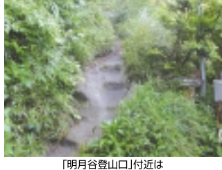
「明月院登山口」付近は意外にラフな登山道

「やくら」(8時34分) やがて30分も掛からず「建長寺登山口」コースへと合流します。「建長寺」へ至る場所に「勝上けん展望台」という絶景スポットがあります。行きは通