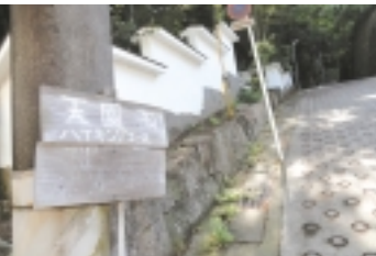
「明月院」入口を通過して右折し急坂を登り、ま

「下野東京ラインの利点を活用！」 鎌倉へはJRを利用しましょう。松戸～鎌倉間は片道運賃1250円。途中下車をするのなら、お馴染み「休日おでかけバス(2670円)」がたいへんお得。そしてこの度、「上野東京ライン」の開通により松戸～鎌倉間を普通グリーン車片道休日料金780円で利用可能となりました。リクライニングシートで、品川乗換1回で鎌倉へ行けるのは快適です。