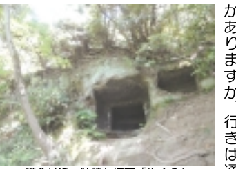
鎌倉付近、独特な墳墓「やくら」

「北鎌倉」駅舎に続く踏切を渡らず鎌倉方面にある臨時改札口を出て、線路に沿って歩いていくと「左折、明月院」への表示が目につきます。実は「天園ハイキングコース」は左折せず直進して辿り着く「建長寺」から登山する観光案内が圧倒的に多いのですが、「建長寺」を通過する際には300円の拝観料が必要となります。「建長寺」は帰り道に寄るとして、今回記者が選んだ登山口は「アジサイ」で有名な「明月院」側にある「明月院登山口」。