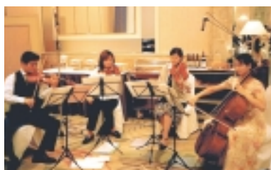
小金北小の保護者でもある音楽家(イメージ)

【音楽を聴きリズムを刻む】 「音楽山チャリティーコンサート」 6月18日(日曜日) 13時30分開場 14時開演 「音楽を聴きリズムを刻む」と称し、二部構成のコンサートが、小金北小学校の体育館で開かれます。