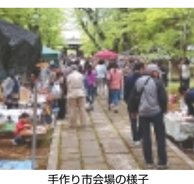
手作り市会場の様子

JR常磐線北小金駅から数分にある東漸寺。参道で毎月第4土曜日に市が開催されています。入口には着物や和装小物アンティーク雑貨のお店が並び、掘り出し物探しにワクワクします。 仁王門から境内までは手作り雑貨のお店がズラリ。布などを使ったアイデア満載かつかわいい小物やアクセサリー、多肉植物の寄せ植え、竹細工のトンボのやじろへえ、温もりのある木工製品、思わずハマってしまう優しい手触りの脳トレ玩具などがあふれています。出店者、商品は開催日により異なりますが、くまなく覗いてそれぞれの店の方と