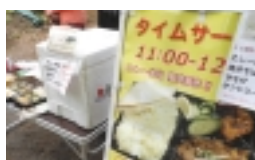
温もりのある木工製品

時間が経ってしまっています。また、北小金駅近くにあるインドカレー店「HIRAMOTHI」やモティアジアンタニングカフェ北小金店が、フルーツを売っています。フルーツ酵母を使ったパンや焼菓も減ったなどというとき、市は毎月開催されています。 インドカレーが味わえます。そして、何かが作られる。自分自身も出店してみるのはいかがでしょうか。 なお、毎月第一日曜日には、柏駅東口徒歩5分にある長全寺でも、同市を開催しています。