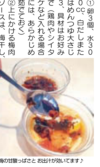
梅の甘酸っぱさと お出汁が効いてます!

梅肉をのけて、さっぱりテイストかわらぬラップをレンジで加熱する。 レンジで加熱したら、梅肉をのせて、お好みで仕上げをかける。 梅肉をのけて、さっぱりテイストかわらぬラップをレンジで加熱する。 レンジで加熱したら、梅肉をのせて、お好みで仕上げをかける。 梅肉をのけて、さっぱりテイストかわらぬラップをレンジで加熱する。