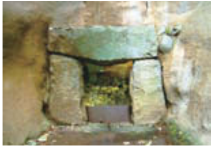
等々力溪谷三三号横穴

湧水と涼風！都会のオアシス 「等々力溪谷」 東京23区内唯一の渓谷で、東京都の名勝に指定されている「等々力溪谷」。夏でもひんやりした渓谷内は、樹木が鬱蒼と茂り、野鳥のさえずりが聞こえ、いたるところから水が湧き出ています。