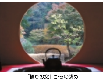
「悟りの窓」からの眺め

もの、「鎌倉」に来た甲斐があった」と感動します。 入場料・通常3000円。アジサイと紅葉の時期は5000円。来た道を鎌倉街道に戻り、明月院から4500メートルほど歩きます。