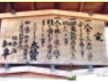
おはやし館の高札

中職などの有力人物が藩主になることが多かったため、「老中の城」と呼ばれ、栄えました。そ