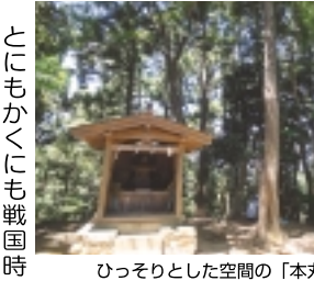
ひっそりとした空間の「本丸跡」

「要害地区は、まさにハイキングコース！」 次に戦闘時に大切となる「要害地区」、山頂「本丸跡」を目指します。 スタート地点の鳥居先から本丸跡近くにある「八王子神社」までの約8kmはひたすら登り道で、第一関門の「金子曲輪」で記者は既にヘトヘトでした(笑)。曲輪とは、物凄く簡単に言えば戦闘の際、兵士を配置する平場です。八合目辺りを過ぎると道は大人が擦れ違うのも困難で危険な箇所もありますが、九十九折りが続く九合目辺りで、それまでの疲れを一気に吹き飛ばす景色が待っています！そこは、筑波山から都心の高層ビルに東京湾まで関東平野を一望できる