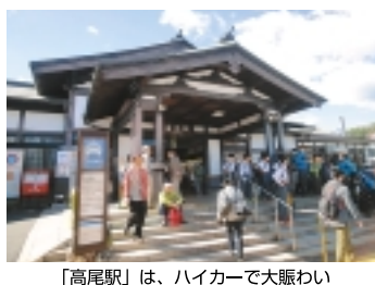
「高尾駅」は、ハイカーで大賑わい

「まずは、城主「北条氏照」のお墓へ」 中央高速のガードを通り、左折すると城下町に当たる地区へ。「宗関寺」を過ぎれば沿道は一層緑深く、「イノシシ注意」の看板も目に付き、山に入ってきた実感が湧きます。城跡入口付近に