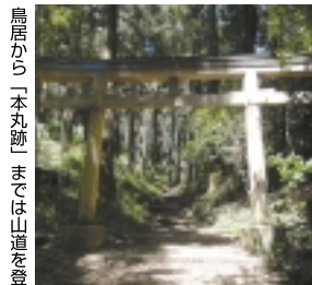
鳥居から本丸跡までは山道を登ります。

「ついに本丸跡に到着！」 「八王子神社」に辿り着けば本丸跡までは後少し。九合目付近で、それまでの疲れを一気に吹き飛ばす景色が待っています！そこは、筑波山から都心の高層ビルに東京湾まで関東平野を一望できる