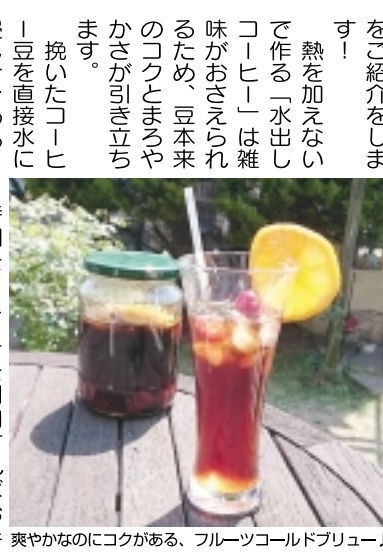
爽やかなのにコクがある、フルーツコールドブリュー

冷たい飲み物が恋しい季節に「爽やかな風薫るアイスコーヒー」はいかがですか。 今回は、「熱湯を使わず時間をかけて抽出したコールドブリュー」いわゆる「水出しコーヒー」の簡単なアレンジレシピをご紹介します。 挽いたコーヒー豆を直接水に浸して、ゆっくり時間をかけて抽出(半日〜一日がベスト)、最後にそれをフィルターなどで濾せば「コールドブリュー」の完成です。しかし、そんな手間はかけられない! という方は、最近スーパーなどでも販売されている「水出しコーヒー専用パック」や「水出し缶コーヒー」がおすすめです。 「フルーツコールドブリュー」はクセになっちゃう美味しさですよ!(ミーナ)