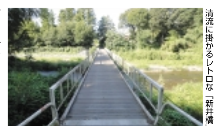
清流に掛かるレトロな「新井橋」

坂道を歩き10分後、金刀比羅神社一の鳥居を通った先で「男坂」「女坂」と分かれ道になります。登山口から緩やかな