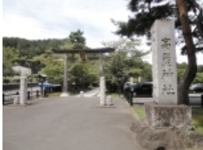
出世するなら「高麗神社」で祈願！

「出世を願うなら」「高麗神社へ！」 聖天院近くにある「高麗神社」を祀る「高麗神社」。宮司は若光の子孫である高麗家が代々務めています。現宮司は60代目、長きに渡り血を絶やさず受け継いできた「子孫繁栄」「子授け」「安産」のご利益は有名で、そしてやたら目立つのが「出世」の文字。調べてみると、近代に各界の著名人