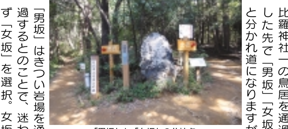
「男坂」と「女坂」の分岐点

「男坂」はきつい岩場を通り過ぎるとのこと。迷わず「女坂」を選択。女坂にも多少の岩場はありましたが、健全ならばストックは必要ないでしょう。