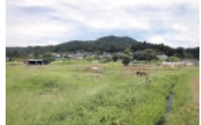
日和田山 (ひわださん)