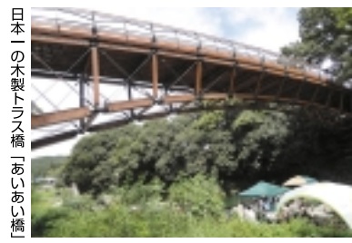
日本の木製トラス橋「あいあい橋」

【聖天院勝楽寺】 巾着田を後にして、高麗川方面へ戻ります。次に向かうは「聖天院勝楽寺」という古刹で、聖天院は「高麗王若光(じやつこう)」が眠る場所であり、高麗家の菩提寺です。