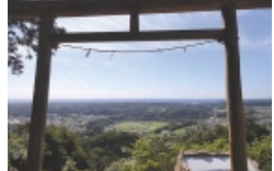
二の鳥居は「巾着田」を見下ろす絶景ポイント!

「二の鳥居」はきつい岩場を通り過ぎるとのこと。迷わず「女坂」を選択。女坂にも多少の岩場はありましたが、健全ならばストックは必要ないでしょう。そして二の鳥居で絶景が待っています。眼下に広がるのはこの後訪れる巾着田の景色に、都心平野部から奥武蔵の山々や富士山まで壮大なパノラマ景色! 登山口から僅か