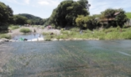
「巾着田」は川遊びをする人々で大賑わい!

坂道を歩き10分後、金刀比羅神社一の鳥居を通った先で「男坂」「女坂」と分かれ道になります。登山口から緩やかな