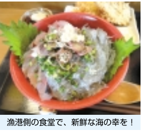
漁港側の食堂で、新鮮な海の幸を!

「小田原漁港」 美味い朝食を 小田原へ行く際、何度も利用しているJR線のおトクな「休日フリーパス」(2670円)は絶対おススメ!松戸、小田原間の往復料金は3880円なので、利用しなればもったいない!浮いたお金で、グリーン車(休日片道780円)を利用すれば快適な旅になります。今回「大雄山線」に乗る前に小田原駅の一つ先「早川駅」で下車。フリーバス区間外なので改札で140円を払い、時刻は朝の9時前目指すは、早川駅から徒歩ですぐの「小田原漁港」。小田原に来たならば朝食は新鮮な海の幸をと、漁港側の食堂で、相模湾朝どれ生シラスと小田原きたら地アジのスペシャル海鮮丼アジフライ付を平らげました!寄り道に