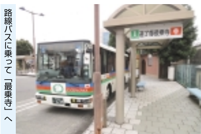
路線バスに乗って「最乗寺」へ

「1ページからのつづき」 駅前には意外にもビルが立ち並び小田原駅に近く活気ある場所でした。駅舎を出て右手にバス乗り場がありますので、道了尊最乗寺行きのバスに乗りましょう。駅を出て狩川を渡るとバスは傾斜のきつい狭い県道を上って行きます。途中、仁王門というバス停があるので、県道が参道なので、バスは山中を進み、駅から約10分で最乗寺入口に到着しました。