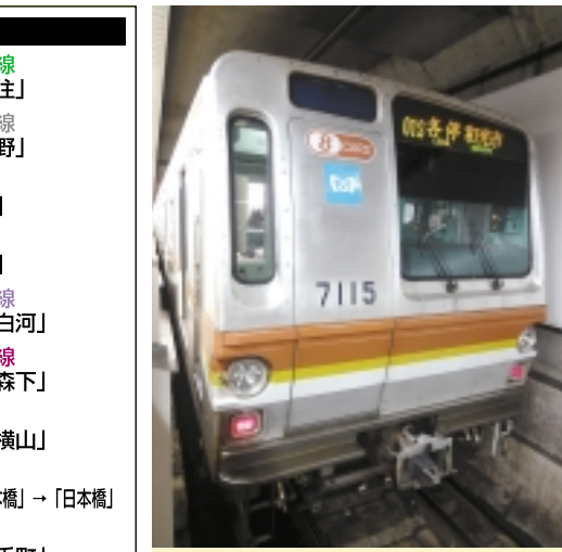
未だ現役「副都心線7000系」