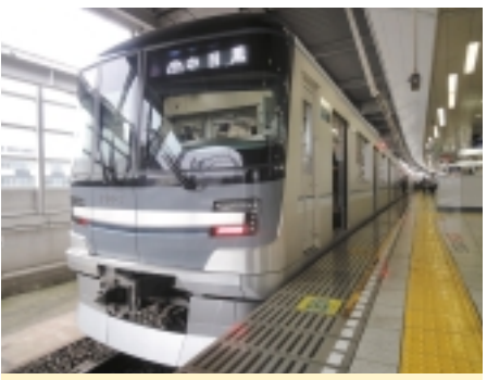
日比谷線最新鋭車両13000系

どこでも便利な一日乗車券 猶予は一日、東京メトロと都営地下鉄13路線の駅を「完乗」!!は敷居が高いと感じ、今回は、13路線の車種に一回は乗るという目的を掲げました。さて費用は一体お幾らなるのかWebをチエックすると、大変お得な乗車券を発見!!それがこの度、利用した「東京メトロ・都営地下鉄一日乗車券」。大人900円・小児450円で、一日13路線が乗降り自由!!まさに当企画に打って付け、さらに東京メトロおよび都営地下鉄沿線360のスポットで、割引やプレゼントなどの特典が受けられる対象乗車券に なっています!!