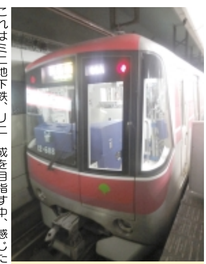
大江戸線最新鋭車両12-600形

押上駅で、半蔵門線に乗り換えませんが、こちらもやってきたのは東急線の懐かしい車両でした。半蔵門線も東武線と東急線が乗り入れていて、肝心の半蔵門線の車両はあまり見られない気がします。でも、様々な会社の車両が見られる、乗れると考えると、それはそれで楽しいのかもしれないですね(笑)