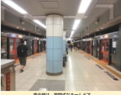
南北線は、密閉的なホームドア

丸ノ内線は、密閉的なホームドア。これは、JR線より高架にある丸ノ内線「四ツ谷」駅。丸ノ内線は、密閉的なホームドア。