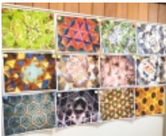
ワークショップ参考写真 「HELLO NEW WORLD ～いつもの世界を新しく～」 (2018・千葉)