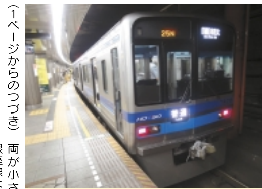
浅草線に乗り入れる「北総鉄道」

成を目指す中、感じたこととは、乗り換えに際して案内板を見れば、おおよそ自由すぎる。これは、リニアモーターカーと違って、乗り換えの際に案内板を見れば、おおよそ自由すぎる。これは、リニアモーターカーと違って、乗り換えの際に案内板を見れば、おおよそ自由すぎる。