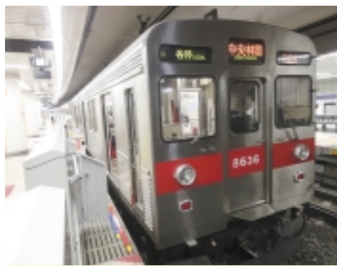
半蔵門線で、懐かしい東急線車両に乗る

半蔵門線で、懐かしい東急線車両に乗る。この車両は、かつて東急線に走っていた車両で、現在は半蔵門線に貸し出されている。乗客からは懐かしさを感じているという。