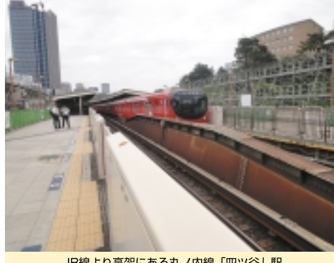
JR線より高架にある丸ノ内線「四ツ谷」駅

や工事期間を抑えることができます。ホームから線路を覗くと、リニアモーターカーに必要なりアクションプレートと呼ばれる装置が線路の真ん中に敷かれていて、分かりやすい。