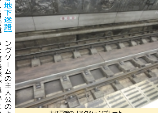
大江戸線のリアクションプレート

大江戸線は、平成にできた地下鉄なので、ホームに行くまでが結構大変！つまり地下深く、地上からの移動が辛いのです。昭和に出来た銀座線とは真逆。そして車