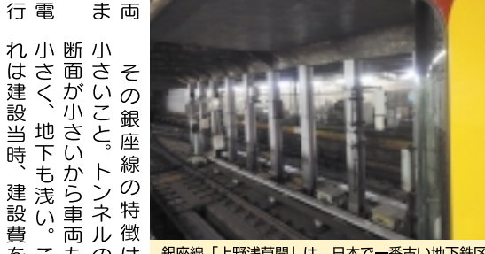
銀座線「上野浅草間」は、日本で一番古い地下鉄区間

「日本で最初の本格的な地下鉄」 上野で銀座線に乗り換えて浅草に向かいますが上野から浅草2.2kmの間は、日本初の本格的な地下鉄開業区間として有名です。