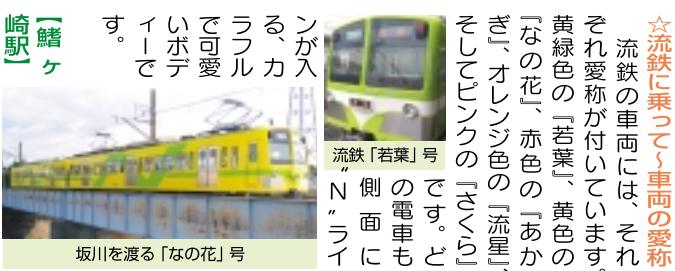
流鉄「若葉」号 坂川を渡る「なの花」号

☆小金城址駅 天正十八年(一五九〇)二月、小金城主の高城胤則は、北条氏に加勢するため、小田原城へ赴きます。五万とも六万とも言われる兵を集結し、小田原城に籠城する北条氏。ところが、十五万から三十万と言われ、圧倒的な豊臣秀吉の勢力