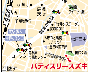
パティスリースズキ

住所 松戸市中和倉 140-2 ☎ & Fax 047-340-2558 営業時間 9:00~19:00 定休日/月曜日 (祝日の場合翌日火曜日)