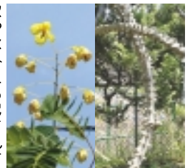
ジャケツイバラの花と蛇のような茎

新元号令和に因んで万葉集に注目が集まっています。真箇の手児奈伝説など万葉集とゆかりの深い市川市。市川市万葉植物園は素朴な万葉人の心をしのび、自然を愛した心を学ぼうとつくられた。30年前の開園当時155種だった植物は現在380種ほどに。和風庭園に育つ植物の傍ら、説明板に万葉名や詠まれている