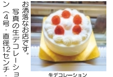
生デコレーション

お洒落なお店です。写真の生デコレーション(4号・直径12センチ・2千円・税込)は、甘酸っぱい苺と甘さを抑えた生クリームがたっぷりふわふわのスポンジとのバランスが絶妙の人気商品です。風味豊かなサブシ。パンに乗せても、紅茶に入れても美味しい。コンフィチュールなど手作りの銘品揃い。取材中笑顔に溢れたお客さまが来店され「明日、子供の誕生日なので名前を入れて下さい」と生デコレーションを注文される出会いがありました。