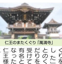
仁王のまたくぐり「萬満寺」

☆流鉄に乗って 流鉄とは? 大正五年(一九一六)に営業を開始し、今年で103年目を迎える歴史ある鉄道です。かつては、流山駅と野田醤油株式会社(現:流山キッコーマン株式会社)を繋ぐ貨物の引込線があり、原料や商品の輸送も担っていました。「都心から一番近いローカル線」は二両編成で単線。沿線住民の