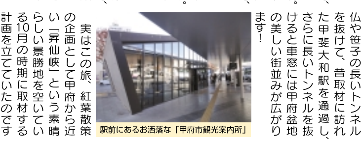
駅前にお洒落な「甲府市観光案内所」

実はこの旅、紅葉散策の企画として甲府から近い「昇仙峡」という素晴らしい景勝地を空いている10月の時期に取材する計画を立てていたのですが、台風19号の土砂崩れ災害により、中央本線の高尾〜大月間が長らく不通となり、やむなく12月の掲載にスライドしました。甲府に着くと、案の定昇仙峡行きのバス乗り場は長蛇の列。昇仙峡観光で大半の時間が取られ、紅葉はバスです。武田神社に向かいます。