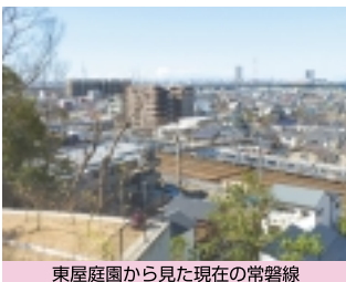
東屋庭園から見た現在の常磐線

増加が加速したのは、およそ百年前に南関東で起こった大地震、いわゆる関東大震災以降です。