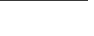
新橋碑 (松戸市新作)