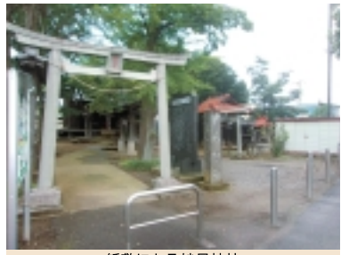
紙敷にある妙見神社

平将門の父である平良将は、下総国を治めたのは、平将門の父である平良将が、その死後は、それが坂東の地を分け合つて統治しました。 望(たいら)のたかもちとなつた高望王は、その地を下総国(松戸を含む千葉東部と茨城県西部を中心とした地域を治める)になりなす。いわゆる「坂東」と呼ばれた。現在の関東地方一帯です。高望王には十人の男子があり、その死後は、それが坂東の地を分け合つて統治しました。 望(たいら)のたかもちとなつた高望王は、その地を下総国(松戸を含む千葉東部と茨城県西部を中心とした地域を治める)になりなす。いわゆる「坂東」と呼ばれた。現在の関東地方一帯です。高望王には十人の男子があり、その死後は、それが坂東の地を分け合つて統治しました。