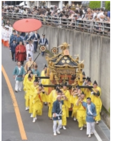
前回神幸祭から宮御輿

行列は10時00分に松戸神社を御発興します。「神幸祭」は当初2020年10月に予定していましたが、感染拡大防止の観点から延期していたもので、今回は松戸駅西口方面のみの巡行となります。巡行の後半、KITE MITE MATSUDO(キテミテマツド)から松戸神社までは、2019年に修復し輝きを取り戻した“宮神輿”を各自治会・町会の200人以上が順に担いで練り歩きます。