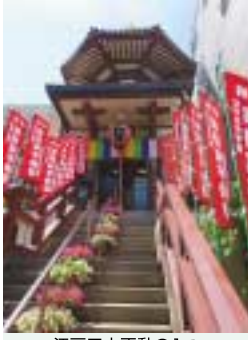
江戸三大不動の1つ「薬研堀不動尊」