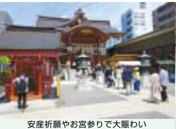
安産祈願やお宮参りで大賑わい

は、出入り口に待機するベヒーカルの数。そして専属のカメラマンを雇って、境内のいたる場所でお宮参りの記念撮影が行われています。その様子を見ると、日本で少子化が進んでいるとは思えません。それとも昔は、もつと混雑していたのでしょうか。そんな水天宮が安産祈願のメッカになった由来は、