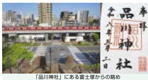
「品川神社」にある富士塚からの眺め

寺)にかつて存在した塔頭・高源院の敷地内。神社に隣接しています。寺跡に位置しています。寺は関東大震災で壊滅的な被害を受けて世田谷区へ移転したため、そこだけが高源院の飛び地として残されたというわけです。また、品川神社には明治初期に造られた都内最大級の富士塚もあり、頂上は平らに整地されていて、都心にしてはなかなかの見晴らしでした。