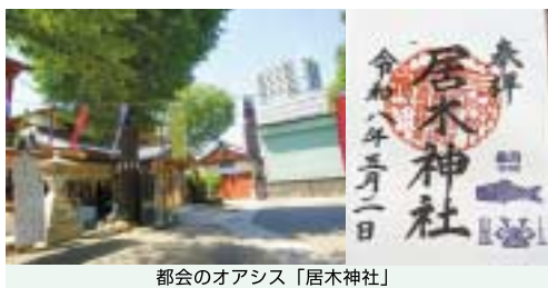
都会のオアシス「居木神社」

中延駅から浅草方面へ一駅戻り、戸越駅で下車します。有名な戸越銀座商店街がそばにあります。が、今回は立ち寄りません。第二京浜から脇道に入ると坂を下ると、前方には大きなビル群が見えてきます。そしてたどり着いたのは「居木神社」。大崎駅近くで、都会のど真ん中にありながら境内は広々として緑豊か。静寂に包まれています。ま