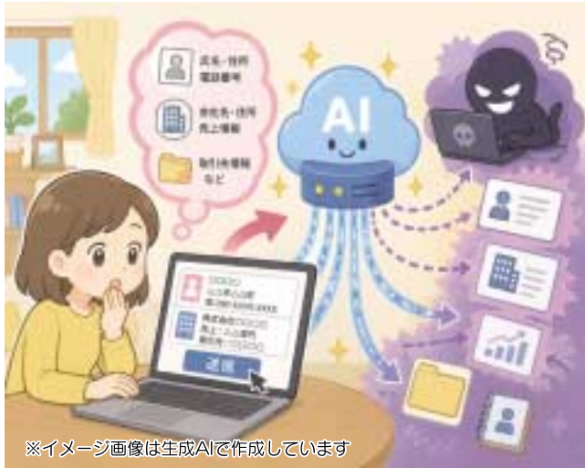
※イメージ画像は生成AIで作成しています

AIの安心設定、正しく付き合うための講習 ChatGPTもGeminiも設定ひとつでぐっと安全に。デジタルAI安全講習会 昨今の急速な生成AIの普及により、私たちの生活や仕事にも大きな変化が訪れています。その変化のスピードに不安を感じる方も少なくないと思います。 例えば、便利なゆえにこのようなことはしていませんか？ 「適当に使えてはいるので、特に設定画面など、じっくり見たことがない」「仕事の資料をそのままAIに入れている」 それ、とても危険です！ ChatGPTをはじめ生成AIは、文章作成や資料作成などに便利で業務の効率化や情報整理に役立っています。 ただし、使い方を間違えると、思わぬ危険につながる恐れがあります。特に注意したいのが、個人情報や会社の情報です。重要な情報を生成AIに入力してしまうと、情報漏洩の危険性があります。 生成AIは便利なツールですが、何を入力してよいか、何を理解したうえで使うことが重要です。変化の激しい今だからこそ、まずは安全な使い方を知らなければならないのです。 【目撃される実践型】 お持ちいただいた端末を使い、「自身の手で操作を覚えていただく」ことで、講習後も迷わず使えるようになります。 このような内容ですのでご自宅に帰って、安心して使用できる環境を整えることができます。 「リスクへの目利き」 何が危なくて、どうすれば安全か。専門家の視点でポイントを絞って解説します。 【安心設定の実施】 ChatGPTやGeminiのプライバシー設定を見直し、安心して使うための設定を完了させます。 「リスクへの目利き」 何が危なくて、どうすれば安全か。専門家の視点でポイントを絞って解説します。 【安心設定の実施】 ChatGPTやGeminiのプライバシー設定を見直し、安心して使うための設定を完了させます。 「リスクへの目利き」 何が危なくて、どうすれば安全か。専門家の視点でポイントを絞って解説します。 【安心設定の実施】 ChatGPTやGeminiのプライバシー設定を見直し、安心して使うための設定を完了させます。