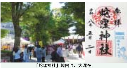
「蛇窪神社」境内は、大混在。

たのですが、境内にたどり着いてビックリ！水天宮に負けない人混みで御朱印待ちもすごい列です。ここでは銭洗いを体験しましたが、一つひとつ丁寧にやり方を教えてくれて、なかなか面白い体験でした。