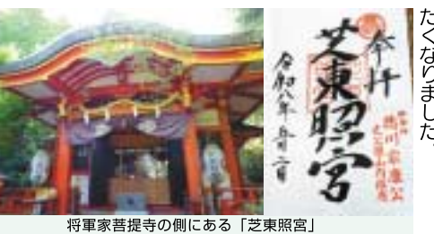
將軍家菩提寺の側にある「芝東照宮」

前に位置する宗急「新馬場」駅から150円馬場へ。三田駅から三田線に乗り換え芝公園駅で下車。徳川將軍家の菩提寺である増上寺は知っていました。そばに東照宮があることは知りませんが、規模は小さいですが、東京タワーの近くという大都会にありながら緑深く、とてもいい雰囲気。都心に東照宮が他にどれくらいあるのか、思わず調べたくまりました。